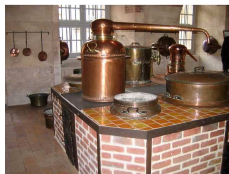
Ancienne pharmacie dite Tisanerie .

Resté aujourd'hui parfaitement lisible, cet ensemble témoigne de l'architecture publique des XVII e et XVIII e , siècles y compris par ses intérieurs (la Salle des Actes aux lambris du XVIII e siècle) Il s'inscrit dans l'histoire hospitalière, grâce à la conservation d'éléments patrimoniaux comme la pharmacie et la cuisine. La chambre natale de Gustave Flaubert, transformée en laboratoire d'histologie, a été reconstituée en 1923. Intégrée en 1947 à un Musée Flaubert et d'Histoire de la Médecine , dépendant du CHU, elle maintient sur place la tradition hospitalière de ce Lieu de Santé .